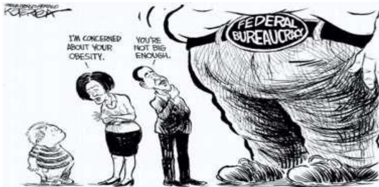
Gambar 5. Birokrasi Gendut