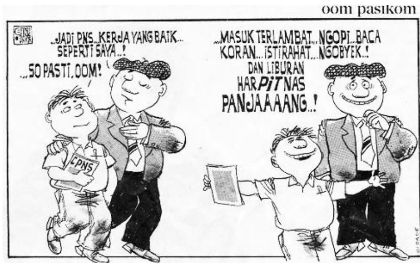
Gambar 8. Citra PNS yang Buruk

Sumber : https://www.google.com/url?sa=i&rct=j&q=&esrc=s&source=images&cd=&ved=0ahU